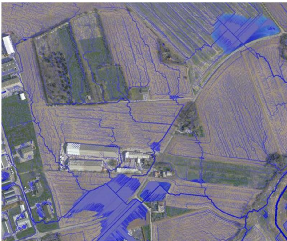
Strømningsveje og udbredelsen af oversvømmelse med vanddybder på mindst 10 cm ved 100 mm regn.

Hvad enten det handler om øgede regnmængder eller havvandstigninger, er det en betydelig udfordring for byerne, men også en mulighed for på en gang at skabe bedre byer på en lang række andre parametre. Vi har mulighed for at sammentænke klimatilpasning med andre vigtige hensyn som f.eks. byliv, blå strøg, arkitektur og design. Med klimatilpasning arbejdes på at tilpasse vores aktiviteter til ændringerne i klimaet. Det vil sige, at der bl.a. fokuseres på udformning og placering af nyt byggeri. Derudover fokuseres på afledning af regnvand. Ved at skabe vandrender og rensningssøer ved ny byudvikling bliver klimatilpasning et aktiv i hverdagen. Det øger områdets attraktivitet, og det skaber værdi for kommende beboere i området.