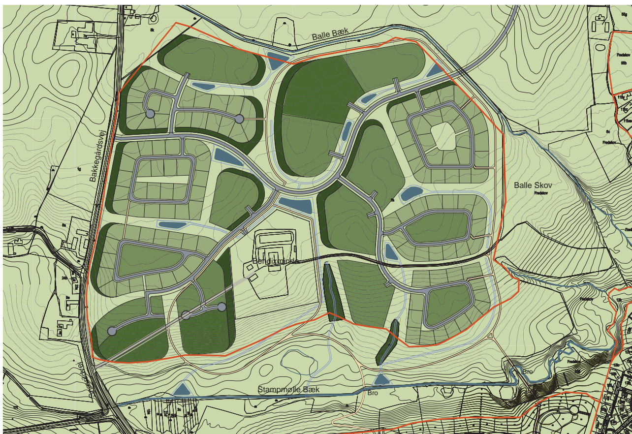
Strukturplan for rammeområde 1.B.39 nord for Stampmølle Bæk