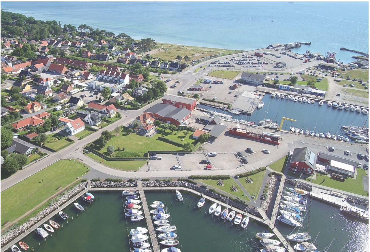
Hov - Byomdannelsesareal ved Hov Havn