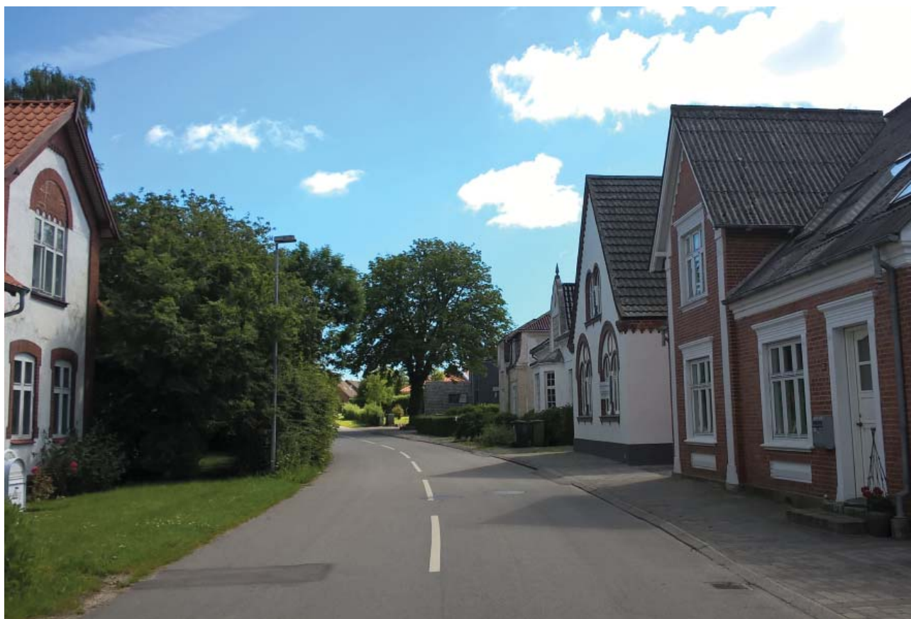
Husrække i Filling