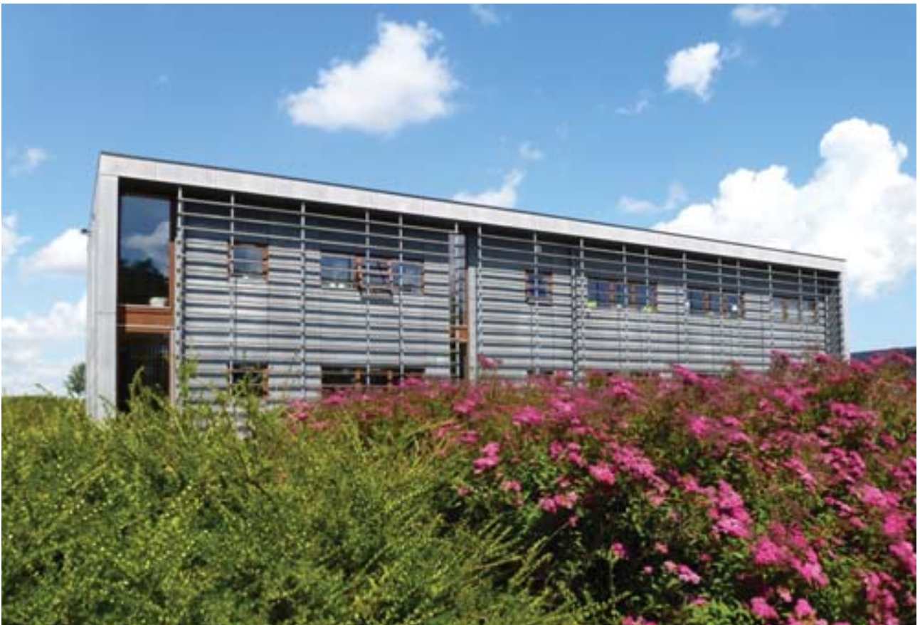
Erhvervsbygning i erhvervsområde ved Rude Havvej