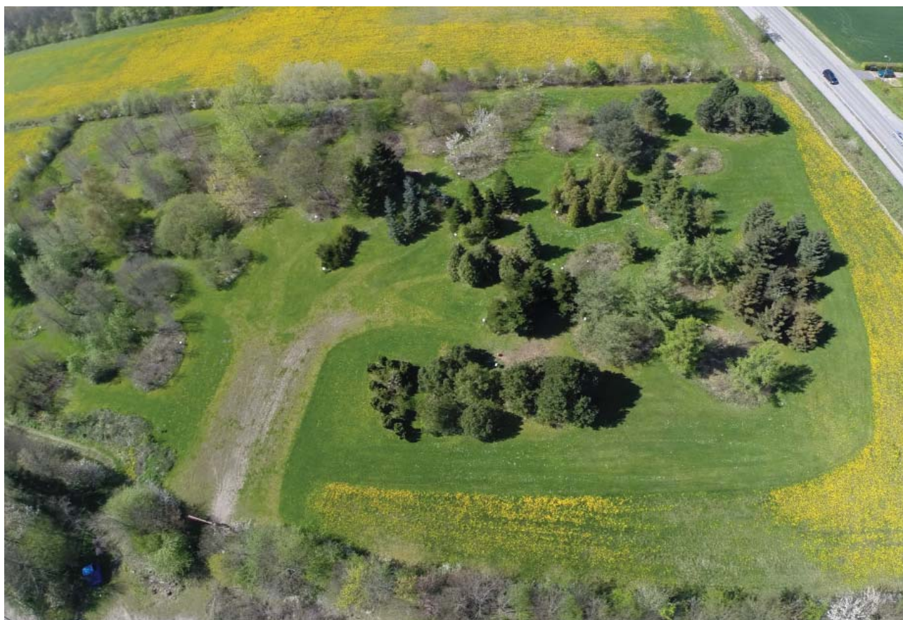
Skoleskoven ved Økologiens Have