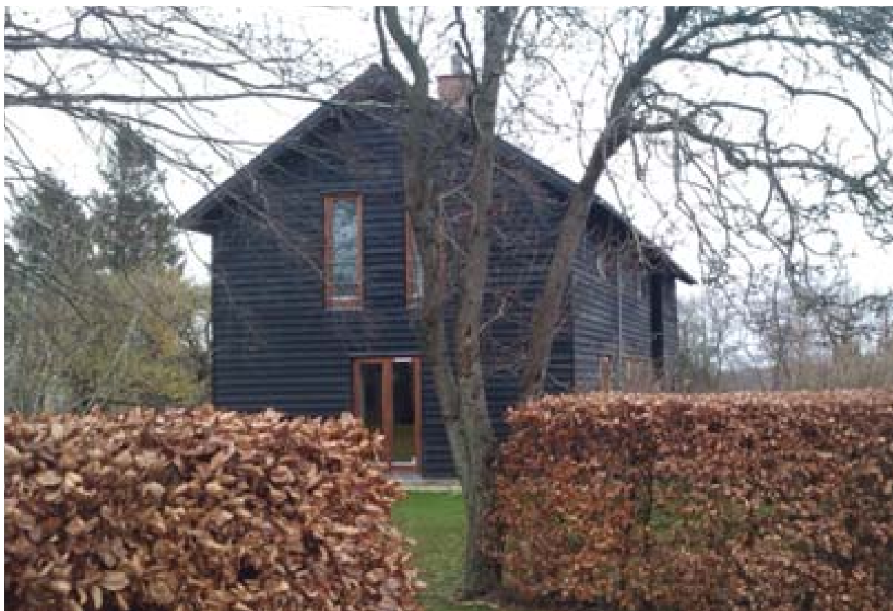
Smukt indplaceret træhus i landzone ved Nølev