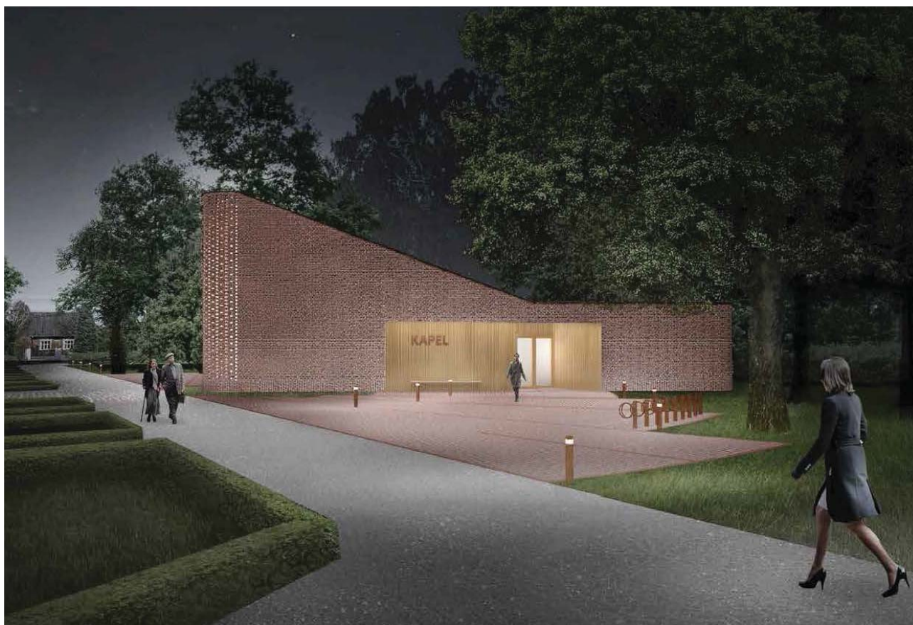
Nyt kapel til Odder Kirkegård. © Illustration: Gjøde & Povlsgaard Arkitekter 2016